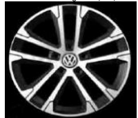
Легкосплавные диски «Singapore» Volkswagen R, 7 J x 17, опционально для Comfortline и Highline (P19)