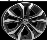
Легкосплавные диски «Soho» 7 J x 17, опционально для Comfortline и Highline (P15)