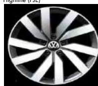
Легкосплавные диски «Marseille» Volkswagen R, 8 J x 18, опционально для Comfortline и Highline (P21)