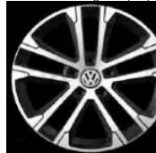
Легкосплавные диски «Singapore» Volkswagen R, 7 J x 17, опционально для Comfortline и Highline (P18)