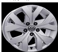
Легкосплавные диски «Moscow» 6.5 J x 16, стандартно для Trendline