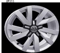
Легкосплавные диски «Aragon» 6.5 J x 16, опционально для Trendline (P11)