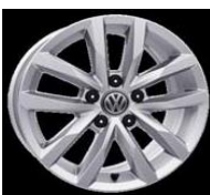
Легкосплавные диски «Serang» 6.5 J x 16, стандартно для Comfortline