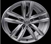
Легкосплавные диски «Dartford» 8 J x 18, серый металл, опционально для Highline (P16)