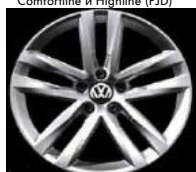
Легкосплавные диски «Salvador» Volkswagen R, 7 J x 17, опционально для Comfortline и Highline (P20)