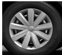
Стальные диски 6.5 J x 16, стандартно для Conceptline