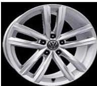
Легкосплавные диски «Dartford» 8 J x 18, серебристые, опционально для Highline (P17)