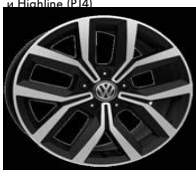
Легкосплавные диски «Nivelles» 7 J x 17, опционально для Comfortline и Highline (P14)