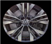
Легкосплавные диски «Alcona» 8 J x 17, стандартно для Alltrack